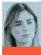
DANIA RAVEL CONSEJERA DEL INE @DANIARAVEL